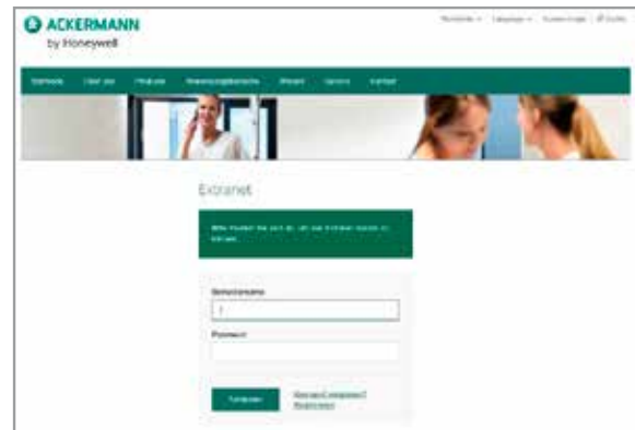
1. Kunden-Login Ackermann

Sollten Sie noch nicht über einen Kunden-Login verfügen, lassen Sie sich registrieren und Sie erhalten in Kürze Ihren Zugang.